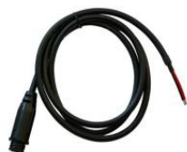
Power Adapter Kabel bei Wechsel VCxx zu ET6x