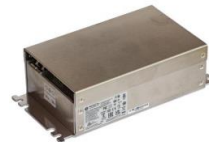
DC/DC Power Supply, wahlweise 9-60VDC oder 50-150VDC