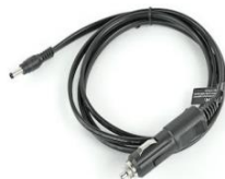
Zigarettenanzünder Adapter, 12V