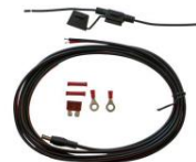
Direct Wire Kit (DC/DC Power Supply <-> Staplerbatterie)