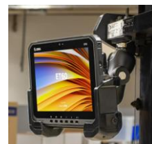
Montagezubehör für die Befestigung im Fahrzeug oder dem Stapler. (Schraub-, Klemm- und Saugnapf- lösungen)

Gerne stehen wir Ihnen für alle Fragen zum Zebra ET60 / ET65 zur Verfügung. Als Engineer in Sachen Auto-ID bieten wir Ihnen neben der reinen Beratung und dem Vertrieb der Hardware auch das nötige Know How, wenn es um die passende mobile Anwendung Service und Support oder um die zentrale Geräteverwaltung per MDM/EMM System geht.